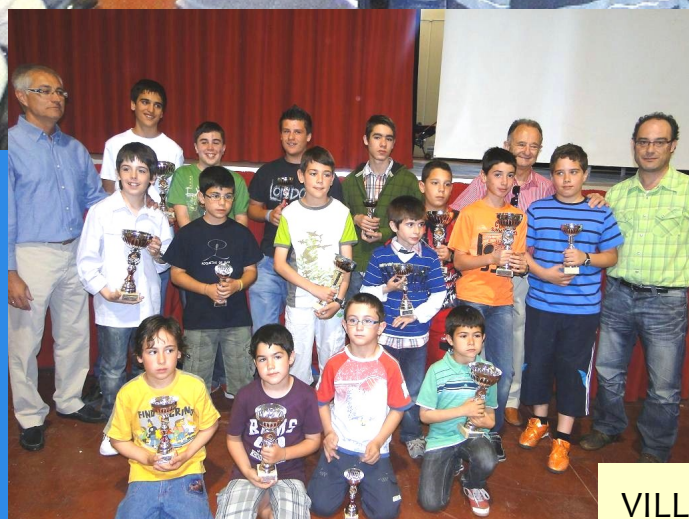
VILLA DE BINEFAR 2010